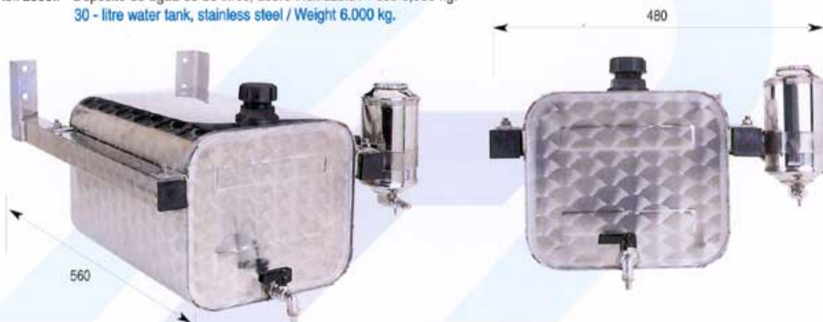
Ref. 2692.I • Depósito de agua de 30 litros, acero inoxidable con soporte y jabonera / Peso 8,500 kg. 30 - litre water tank, stainless steel with support and soap bottle / Weight 8.500 kg.