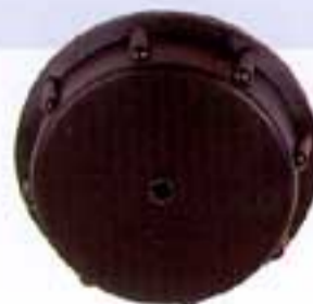
Ref. 2696.S • Tapón plástico para depósito de agua de acero inoxidable / Peso 0,010 kg. Plastic tap for stainless steel water tank / Weight 0.010 kg.