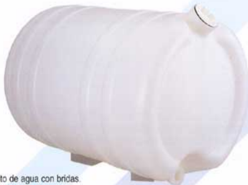
Depósito de agua con bridas. Water tank with hoops.