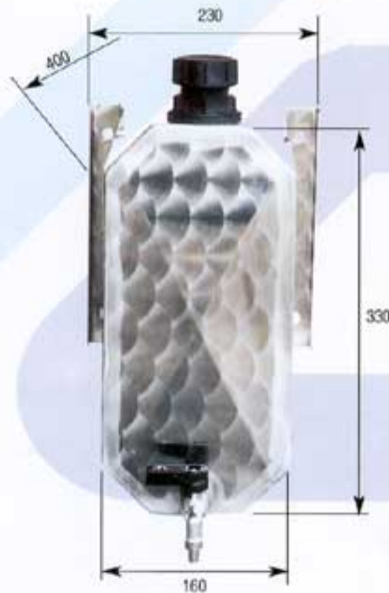
Ref. 2698.I • Depósito de agua estrecho, acero inoxidable / Peso 5,600 kg. Narrow water tank, stainless steel / Weight 5.600 kg.