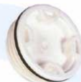
Ref. 2696 • Tapón para depósito de agua de polietileno / Peso 0,025 kg. Polyethylene water tank cap Weight 0.025 kg.