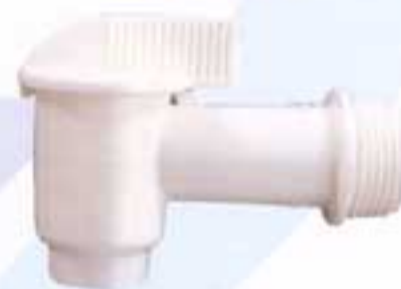
Ref. 2695 • Grifo para depósito de agua de polietileno / Peso 0,020 kg. Polyethylene water tank tap Weight 0.020 kg.