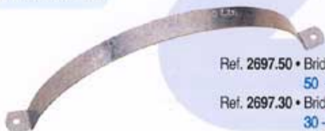
Ref. 2697.30 • Bridas para depósito de agua de 30 litros, chapa galvanizada / Peso 0,365 kg. 30 - litre water tank hoops, galvanized metal / Weight 0.365 kg.