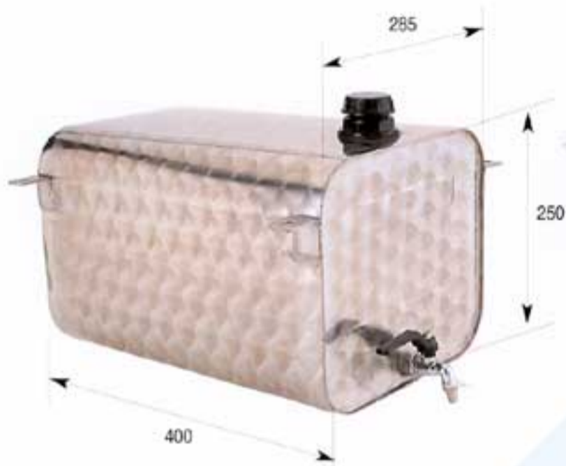
Ref. 2690.I • Depósito de agua de 30 litros, acero inoxidable / Peso 6,000 kg. 30 - litre water tank, stainless steel / Weight 6.000 kg.

Acero inoxidable WATER TANKS / stainless steel