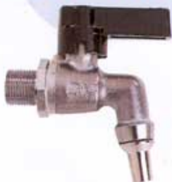
Ref. 2695.I • Grifo para depósito de agua de acero inoxidable / Peso 0,140 kg. Tap for stainless steel water tank Weight 0.140 kg.