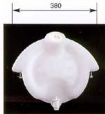
Ref. 2690.SB • Depósito de agua sin bridas de 32 litros / Peso 2,400 kg. 32 - litre water tank without hoops / Weight 2.400 kg.